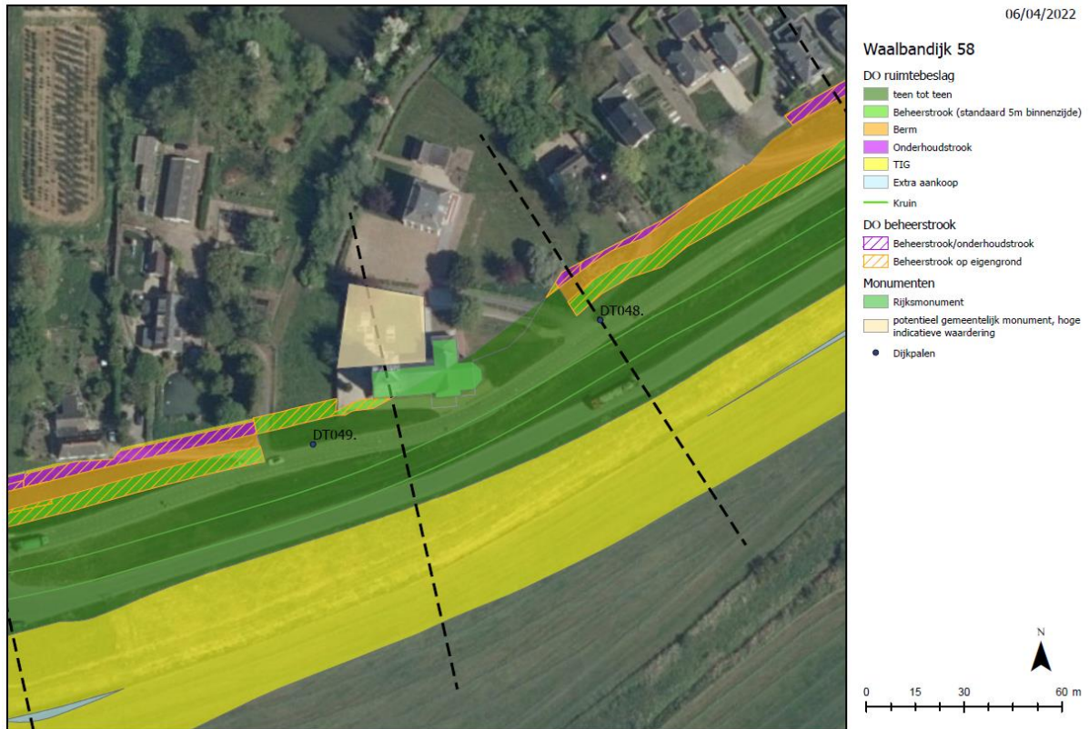
Profiel ter hoogte van Waalbandijk 58 1

Op deze locatie is gekozen de kruin van de dijk naar buiten te verplaatsen. De kruin verschuift zo'n 10 meter naar buiten.