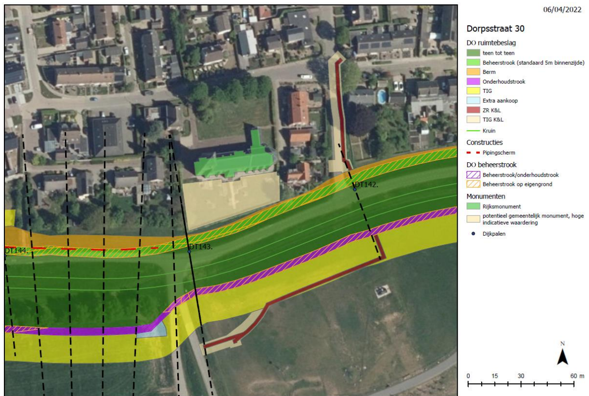
Profiel ter hoogte van Dorpsstraat 30 1

De dijk verschuift naar de rivier en wordt afgegraven tot een berm. De dijk wordt zo'n 60 cm opgehoogd.