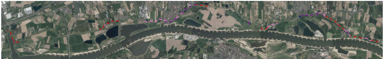
Figuur 2-1 Locaties verticale maatregelen (rood=pipingscherm, paars en roze=stabiliteit+piping gecombineerd)

Op basis hiervan is vastgesteld dat over een lengte van 11,1 km verticale maatregelen nodig zijn om te voldoen aan de eisen ten aanzien van piping.