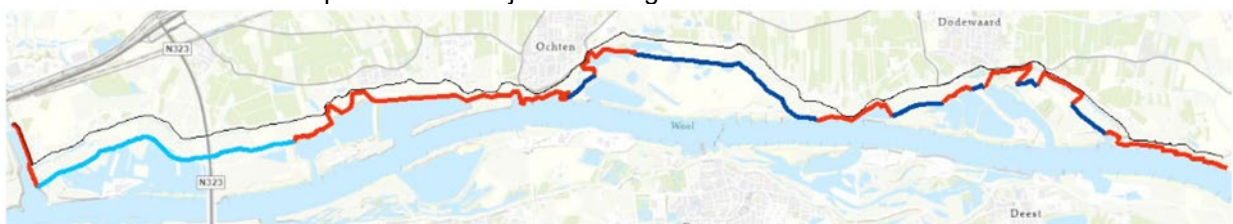
Figuur 2-2 Benodigde beschermingszone in voorland t.o.v. buitenkruin (lichtblauw = 300 m, donkerblauw = 250 m, rood = werkelijk aanwezige voorland) om piping scope gelijk te houden bij toekomstige waterstand

Nieuwe inzichten leiden op bepaalde trajecten dus tot een grotere benodigde beschermingszone dan de voorheen gehanteerde 150 m. Deze vergroting van de beschermingszone in het voorland maakt onderdeel uit van het concept DO van de dijkversterking.